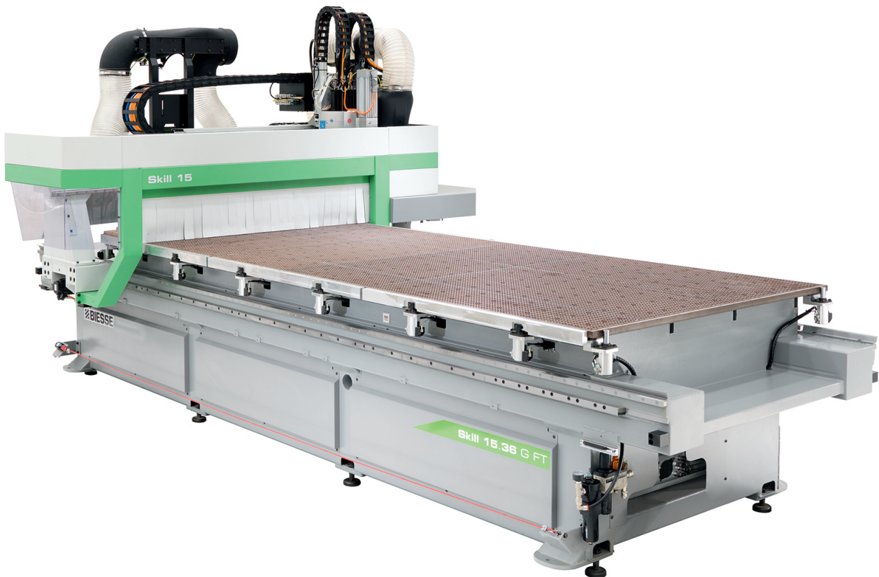
Biesse Skill GFT 1224